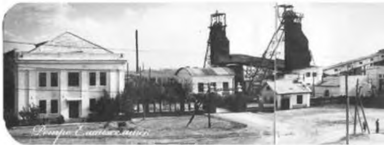
Шахта 19-а, 1939 год